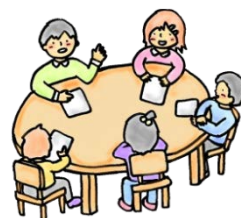
こども能力開発トレーニング