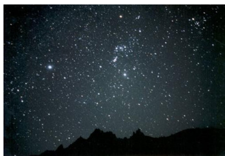
ナイトハイキング